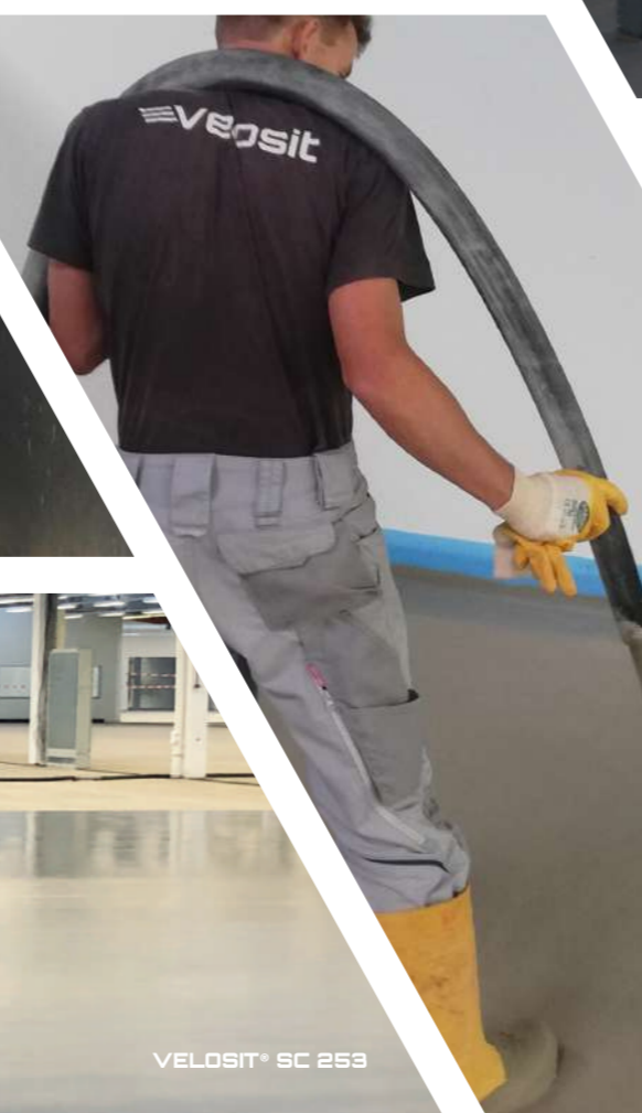
VELOSIT® SC 253