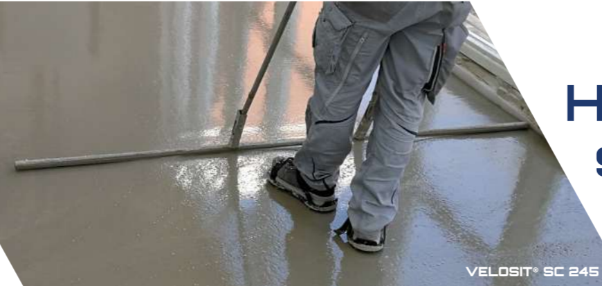
VELOSIT® SC 245