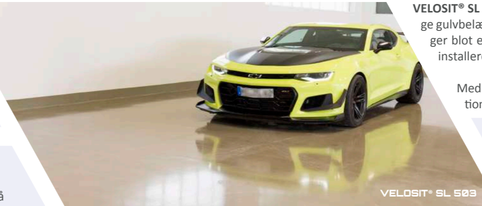
VELOSIT® SL 503